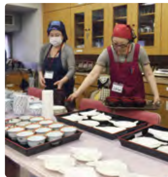
NPOキッズ未来プロジェクト 理事長として活動中！

昨年度の東京都全体での待機児童数は 7814人 。子どもを預けて働きたい保護者にとって切実な問題です。 保育士の待遇改善等の施策 を通じて保育を充実し、 若い家族が安心して働き、子どもを育てる事ができる環境 を整備します。また、子どもたちの 6人に1人が 貧困に陥っているとされる「子どもの貧困」に取り組み、「子どもの居場所」や「子ども食堂」のネットワークを構築し、 「地域の子どもを地域で育てる」 環境を作ります。