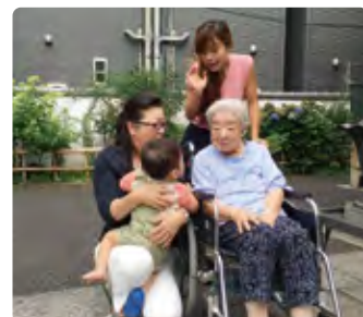
全ての世代にとって暮らしやすい東京に！

また、国民年金 5万4544円 (平成25年度の平均額)では老後の生活を支えるのに十分ではありません。元気で意欲のある 高齢者が、得意分野を活かして活躍 し続けることを可能にする制度づくりに取り組みます。