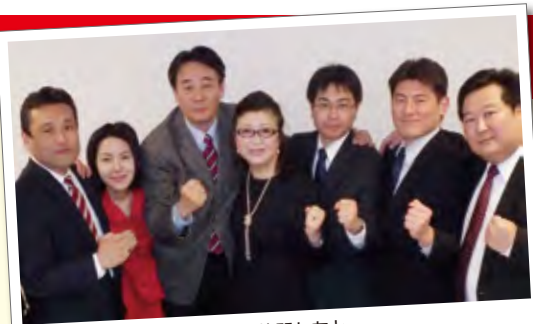
新宿の仲間たちと