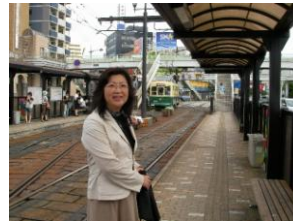
長崎電気軌道線の視察